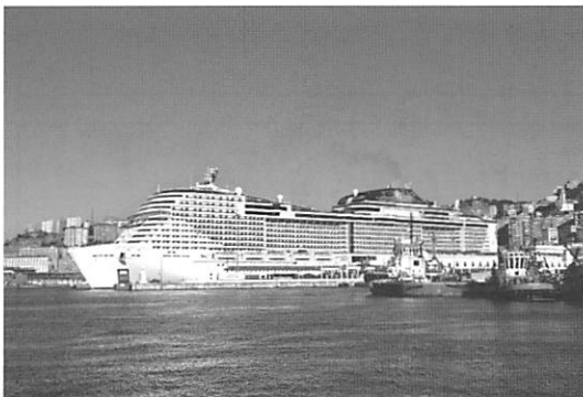
ジェノバの客船ターミナルに着岸する「MSCメラビア」。17万総トンの巨大な船体が印象的。