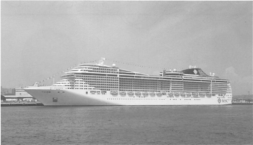
日本発着クルーズにも就航する「MSCスプレディダ」。横浜港での撮影。

さて、乗船したジェノバ港は、イタリアの古い港町で、コロンブスの銅像や館も観光スポットとして定着するところからもその歴史の長さが覗える。帆船の時代から汽船の時代に入ってから、大西洋横断航路の定期客船の玄関港として機能していたが、今は、フェリー基地およびクルーズ客船の発着港として毎日たくさんの客船が出入している。旧港はほぼ円形の形をしており、その中心に向かって放射状に栈橋が並んでいる。