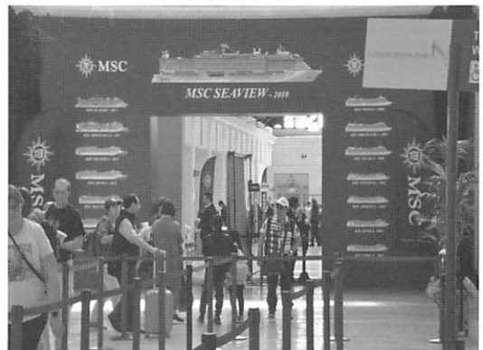
MSCの15隻のクルーズ客船のプロフィールが描かれた乗船ゲート。同社のクルーズ界での急躍進がわかる。